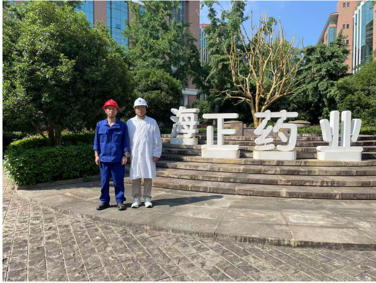
图1：项目组成员勘查现场照片