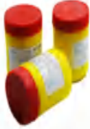
上海斯米克QJ102银钎焊熔剂